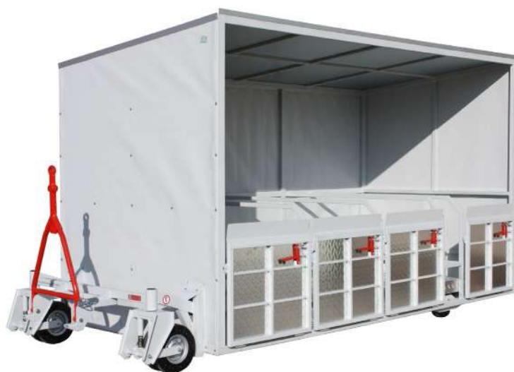
MOD. 18-TRS - Versione con sospensioni anteriori