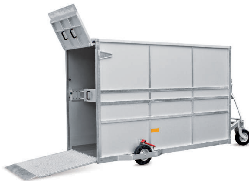
MOD. 18-S - Versione furgonata