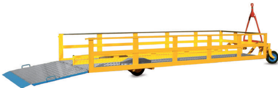
MOD. 18-S - Versione per carrelli spesa